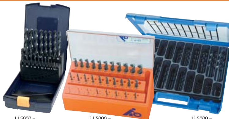
11 5000 – 11 5440_1–10

Accessori speciali: Cassetta Dim. 1–13K n. art. 11 5470 e 11 5480.