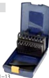
11 5470_1-6 fino a _1-13