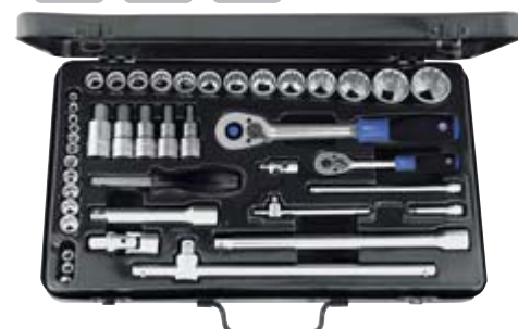
63 0100 HOLEX