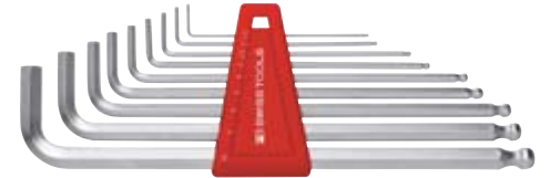
62 7330_9 PB SWISS TOOLS