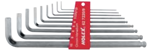
62 7220 HOLEX