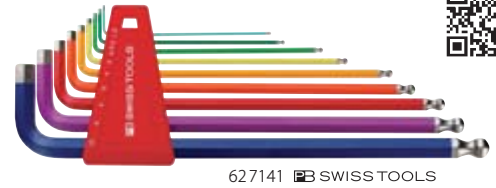
62 7141 PB SWISS TOOLS

Esecuzione: Dim. 12Z – Chiavi, misure in pollici.