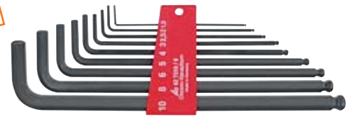
62 7310_9 HOLEX